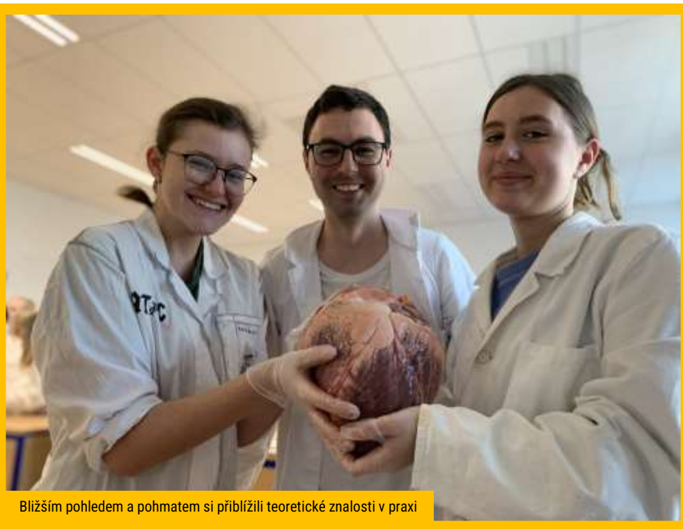
Bližším pohledem a pohybem si přiblížili teoretické znalosti v praxi

Požadavky doby velí věnovat pozornost také výuce cizích jazyků. Škola v rámci rozvoje jazykových znalostí žáků neustále rozšiřuje servis nabízených služeb v této oblasti. Pravidelně se pořizují cizojazyčné materiály určené k zapůjčování, v nabídce volitelných předmětů je např. seminář přípravy na certifikát FCE a CAE, seminář anglické translologie či seminář z historie v angličtině. Pedagogové nabízejí osobní konzultace, organizují pre-testy a zajišťují ostré zkoušky, od centrálního přihlašování a platby až po realizaci testů. Angličtina, francouzština, ruština a španělština jsou posíleny podle možností o hodiny s rodilými mluvčími, čímž získávají žáci možnost