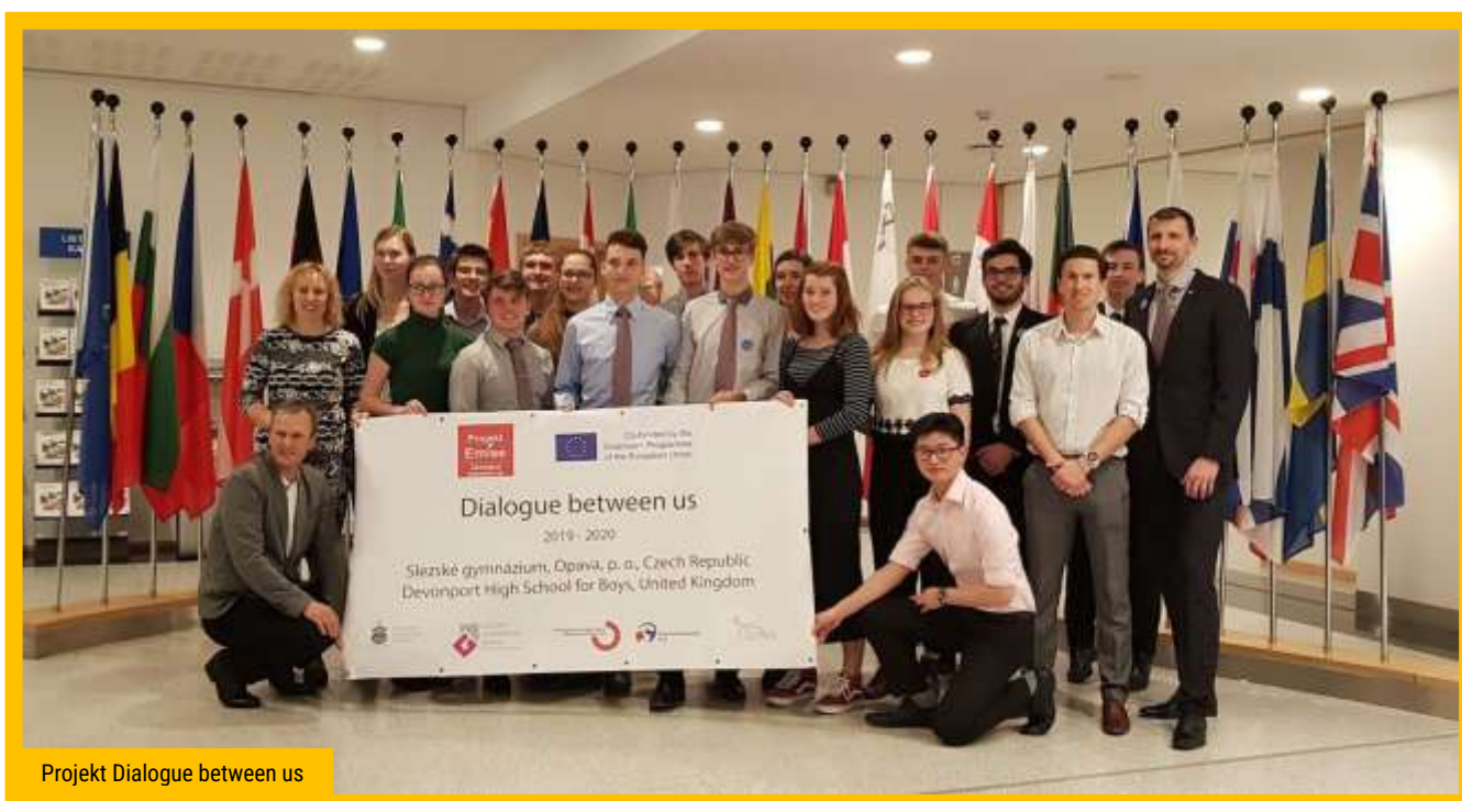
Projekt Dialogue between us