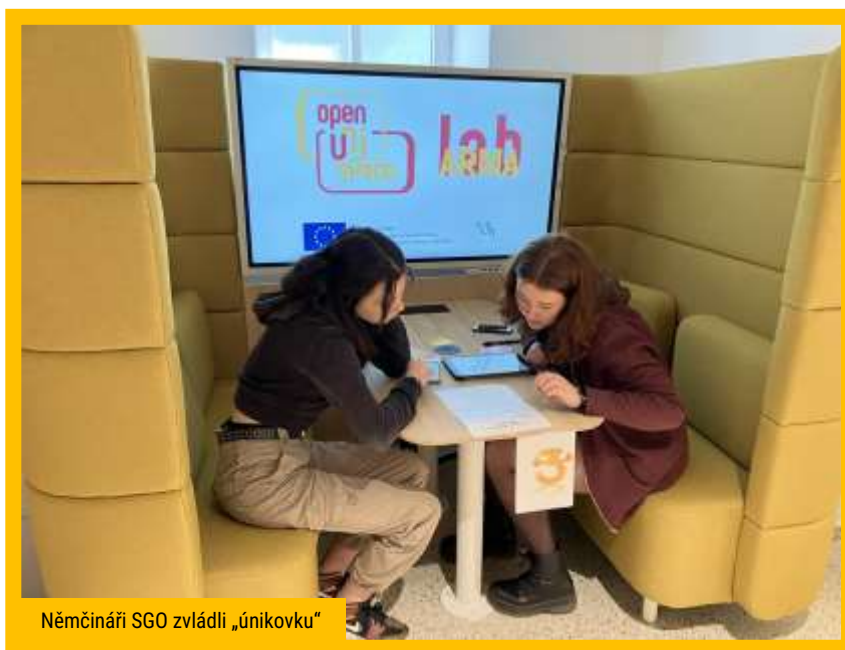
Němčináři SGO zvládli „únikovku“

Slezské gymnázium je univerzitním gymnáziem Slezské univerzity v Opavě . Obě instituce spolu čile komunikují a probíhá mezi nimi aktivní spolupráce. Pedagogové Slezské univerzity pak v pozicích odborníků zaujali čestná místa v komisích a porotách některých soutěží (jazykové soutěže, fotografická soutěž Oko prázdnin aj.), univerzita je také vyhlašovatelem či realizátorem některých ze soutěží. Pedagogové Slezského gymnázia se věnují studentům SLU a pomáhají jim vést jejich povinné pedagogické praxe. Mj. se žáci v letošním roce účastnili soutěže vtipné němčiny – jednalo se o vytvoření krátkých vtipných textů k předvybraným karikaturám. Akci pořádala Slezská univerzita v Opavě se společností Bohemia Troppau. V rámci pravidelné spolupráce s katedrou germanistiky SU absolvovali žáci 1. B projekt Echo Game . Jednalo se o interaktivní pojetí pohádky Bremer Stadtmusikanten. Rovněž se letos realizovala oblíbená soutěž Dramawettbewerb , soutěž v dramatizaci německého textu, pořádaná katedrou germanistiky Slezské univerzity v Opavě. Vybraní žáci 2. B sehráli scénky v německém jazyce. Důležitý byl kromě hereckého projevu také přednes a dramatizace v německém jazyce. Soutěž proběhla živě před odbornou porotou složenou z vyučujících katedry germanistiky. V rámci pravidelné spolupráce s katedrou germanistiky SU absolvovali žáci 1. B projekt Exit Game . Jednalo se o dnes tak populární únikovou hru s motivem Jak žil Goethe. Klasika se tedy prodchla s moderními technologiemi.