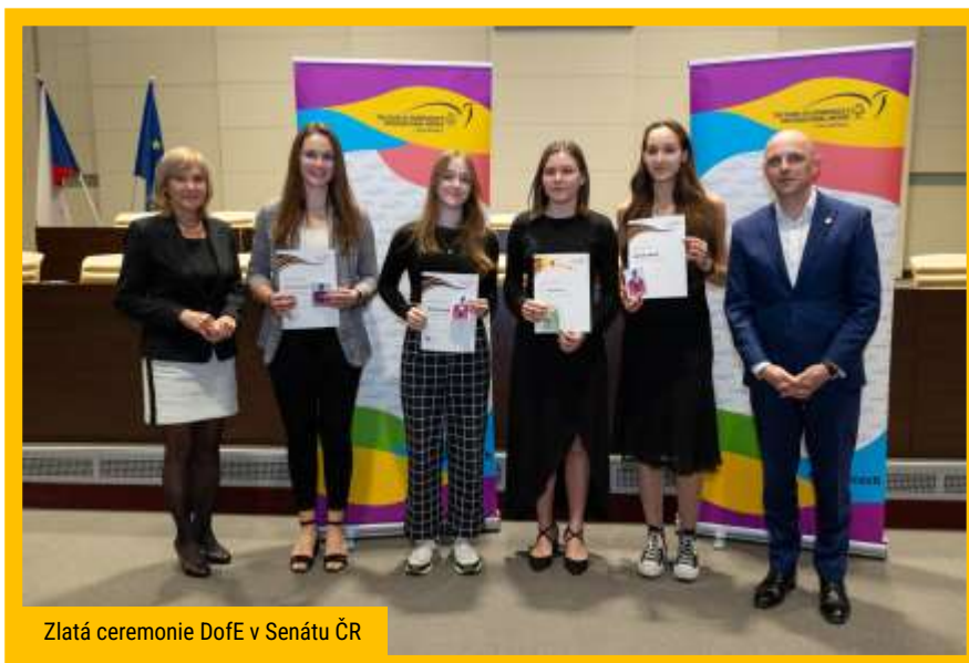
Zlatá ceremonie DofE v Senátu ČR

Obrovským úspěchem je získání nejvyšší, zlaté úrovně programu DofE. Pod taktovkou senátního Výboru pro vzdělávání, vědu, kulturu, lidská práva a petice bylo 9. dubna 2024 na půdě Senátu předáno ocenění 82 absolventům programu Mezinárodní ceny vévody