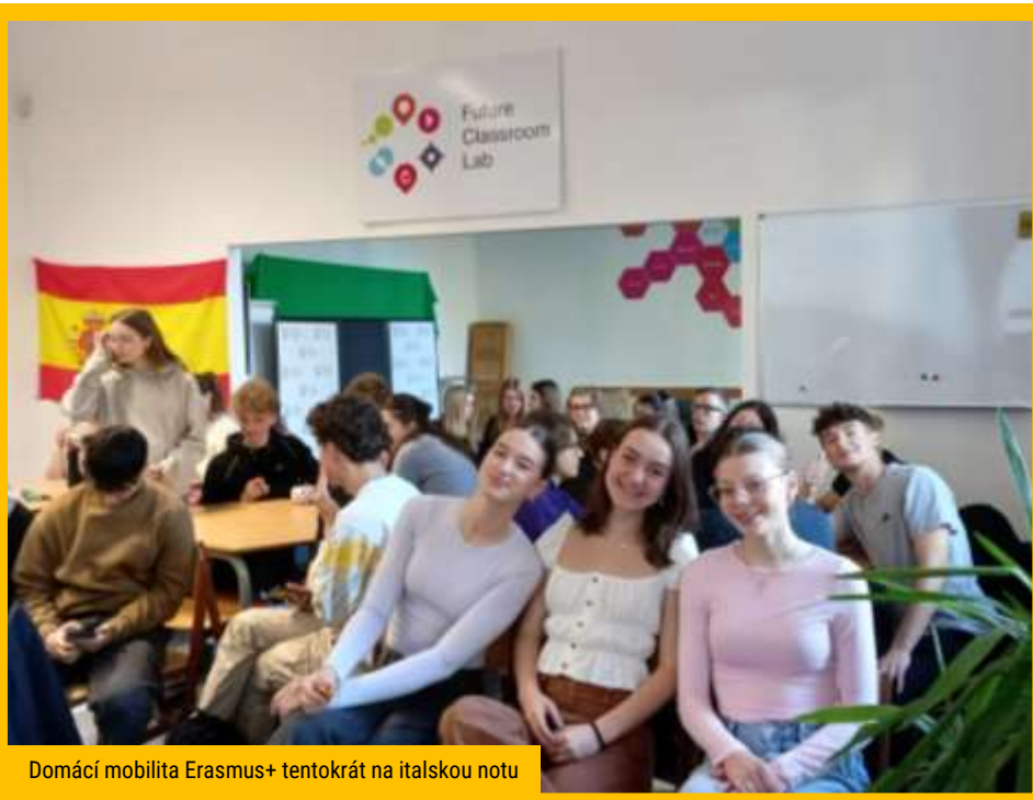
Domácí mobilita Erasmus+ tentokrát na italskou notu

Pedagogové získané poznatky přenesli do praktické výuky do učebny Future Classroom Lab , která díky flexibilnímu uspořádání prostoru umožňuje využít různé styly učení. Učebna se tak stala zároveň projektovou učebnou, ve které se učitelé vzájemně inspirují, předávají si získané znalosti a poznatky. Učebna slouží jako prostor pro žakovský a učitelský tým Erasmus na naší škole. Nová koncepce vzájemné kolegiální podpory se přenáší do společných vzdělávacích tzv. mentorských úterků a do tandemové výuky , ve kterých účastníci projektu sdílejí nové metody a styly učení.